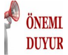
CORONA VİRÜS (COVID-19) SALGINI BİLGİLENDİRME