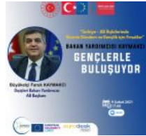
BAKAN YARDIMCISI FARUK KAYMAKÇI GENÇLERLE BULUŞUYOR- SORGED