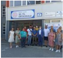
“DİJİTAL EĞİTİMİ DESTEKLEME PROJESİ” BAŞLIYOR