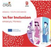
BELEN KAYMAKAMLIĞI, YES FOR INCLUSION PROJE KABUL EDİLDİ