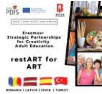
BELEN KAYMAKAMLIĞI, RESTART WITH ART PROJESİ ONAYLANDI